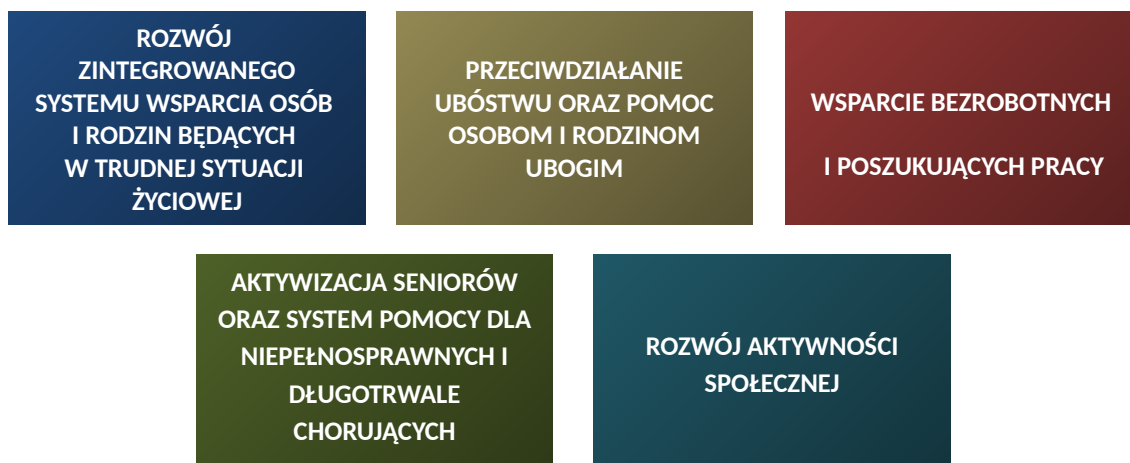
Rysunek 1. Cele strategiczne zawarte w „Strategii Rozwiązywania Problemów Społecznych Gminy Dąbrówka na lata 2016-2021”.

Do każdego z powyższych celów strategicznych w ramach dokumentu Strategii Rozwiązywania Problemów Społecznych przyporządkowano cele operacyjne oraz kierunki działań do celów operacyjnych, umożliwiające realizację założeń dokumentu.