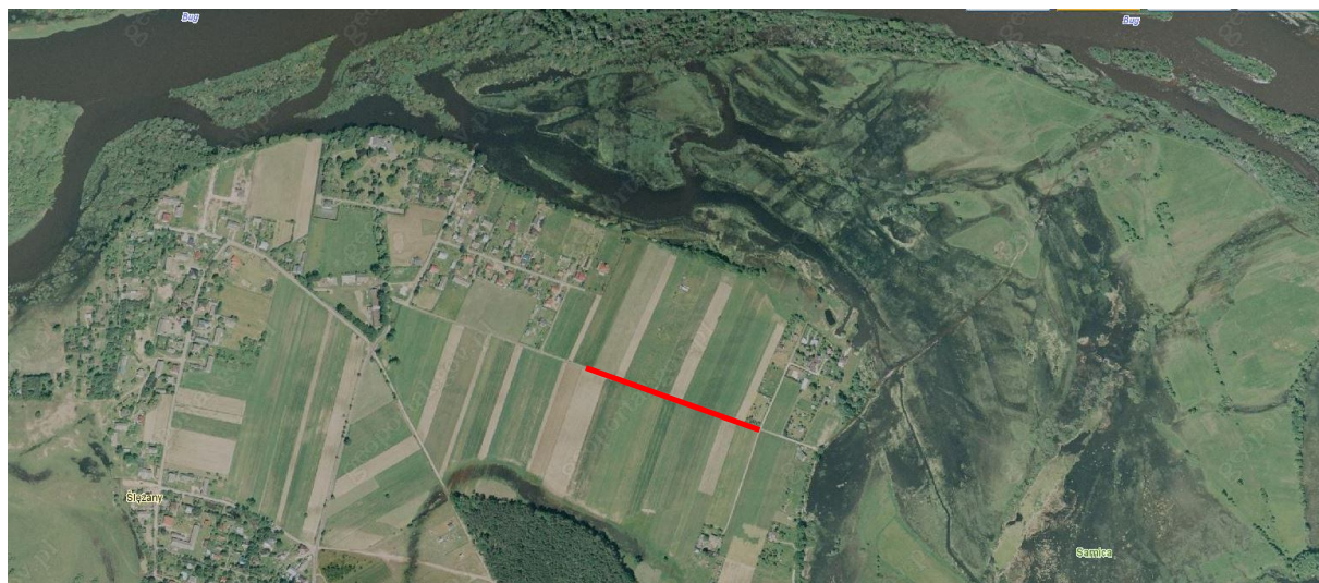
Rys. 1 Lokalizacja inwestycji

Przebudowywana droga przebiega przez tereny użytkowane rolniczo (Rys. 1). Na przedmiotowym odcinku istniejąca droga posiada nawierzchnię z destruktu asfaltowego o szerokości 3,5 m wraz z obustronnymi poboczami gruntowymi. Na początkowym odcinku droga posiada nawierzchnię asfaltową.